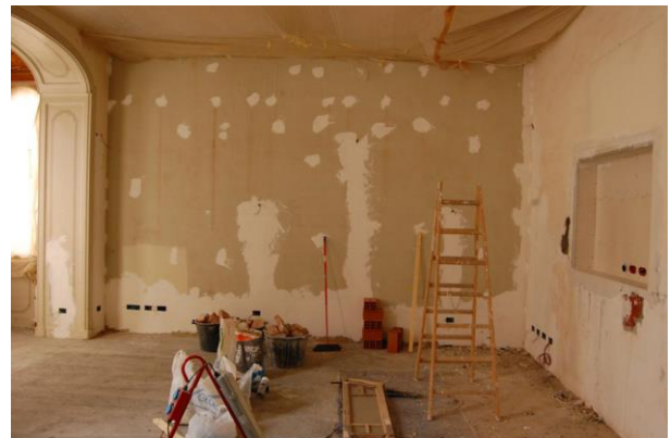
Figura 8 - Lavori di ristrutturazione