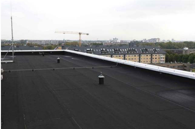
Figura 7 - Impermeabilizzazione solai di copertura