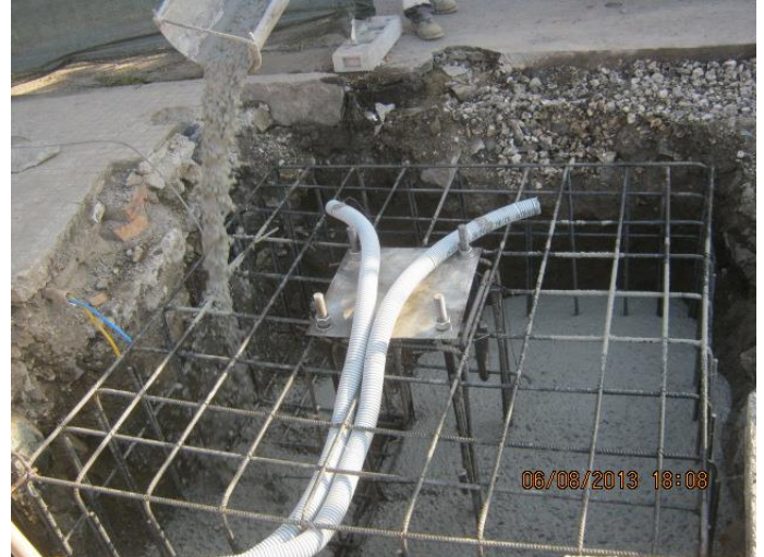
Figura 6 - Realizzazione opere di fondazione