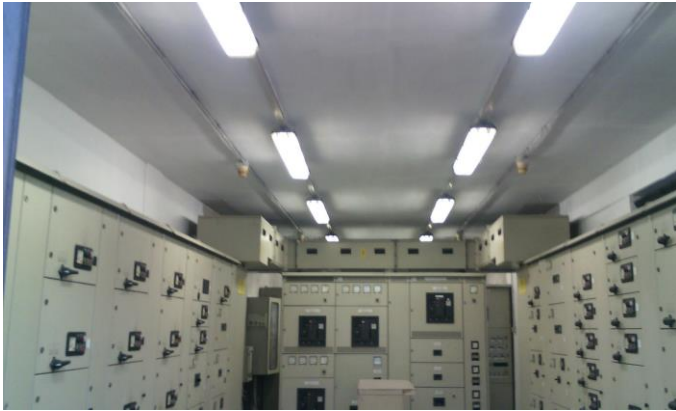
Figura 10 – sistemazione cabina elettrica raffineria ENI

Restauri e manutenzioni stabili, ristrutturazioni interne recupero architettonici ed edilizio, lavori stradali, nuove costruzioni, pitture, verniciature e segnaletica