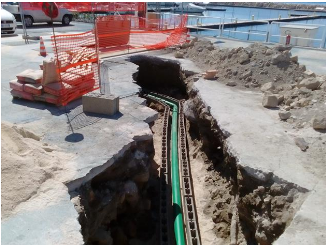
Figura 3 - Realizzazione di cunicoli per la protezione degli impianti interrati