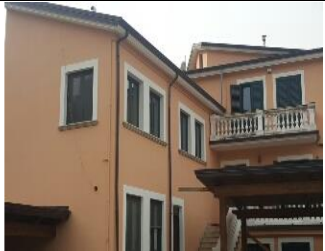
Figura 12 – Fine lavori nel comune di Polla (Sa)