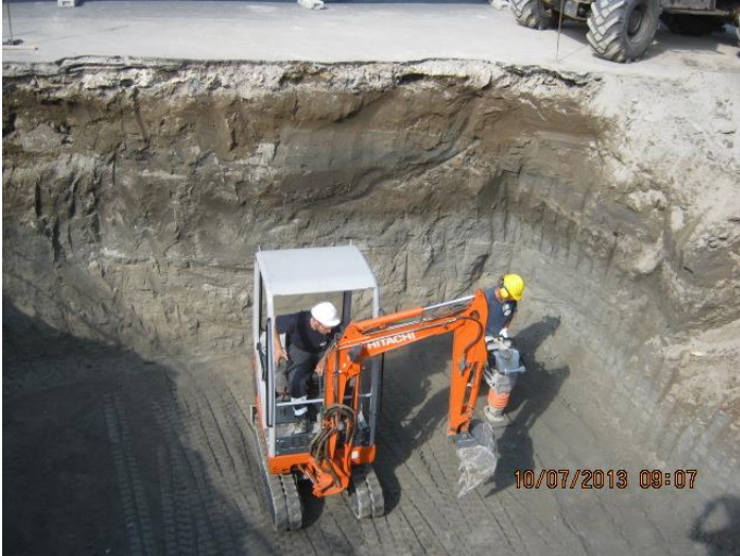
Figura 5 - Attività di scavo e movimento terra

Restauri e manutenzioni stabili, ristrutturazioni interne recupero architettonici ed edilizio, lavori stradali, nuove costruzioni, pitture, verniciature e segnaletica