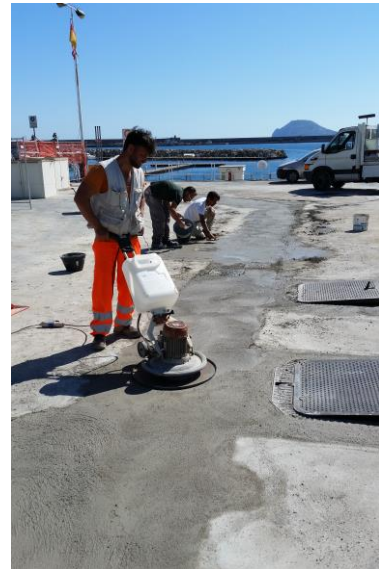
Figura 4 - Ripristino pavimentazioni