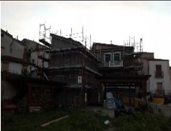
Figura 11 – inizio lavori di facciata nel comune di Polla (Sa)