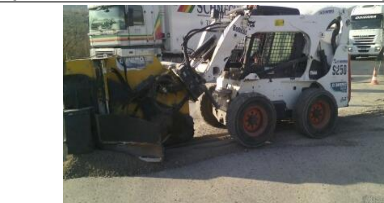
Figura 13 – Scavo mini trincea - S. Mango Piemonte (Sa)