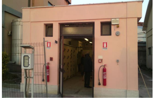
Figura 9 – cabina elettrica raffineria ENI