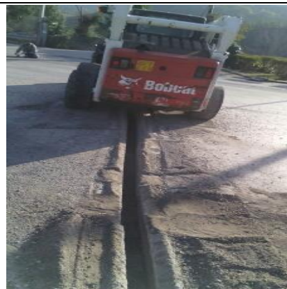
Figura 14 – Scavo mini trincea - S. Mango Piemonte