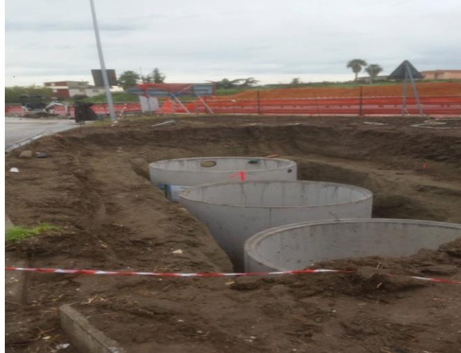
Figura 15 – impianto di disoleazione acque piazzale