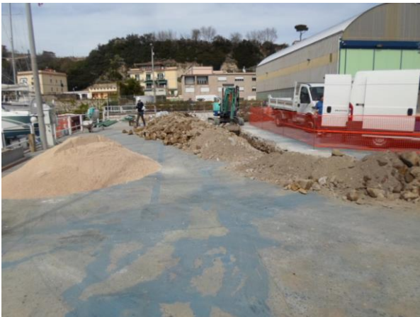
Figura 1 - Scavi a sezione obbligata per interrimento impianti